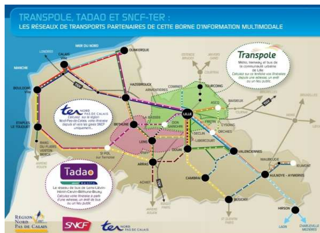
Périmètre du projet de borne d'information multimodale